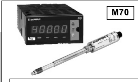
硬杆组态使安装方便快捷