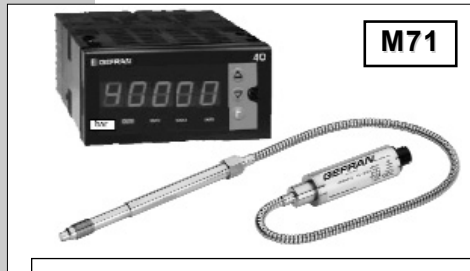
软杆组态用于要求更高热隔离或难以安装の場合